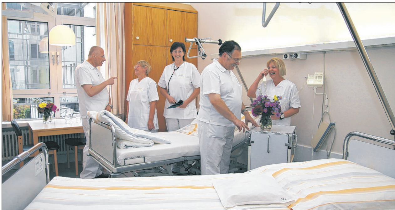
Hell, großzügig ausgestattet und in einem freundlichen Farbton: Auch die Patientenzimmer in der Inneren Abteilung der Feuchtwanger Klinik wurden auf den neuesten Stand gebracht.

Natürlich freue er sich auf die Eröffnung: „Ich bin froh, wenn es endlich losgeht.“ Und: „Wir sehen der Zukunft sehr zuversichtlich entgegen.“ Die Patienten könnten bereits heute ab 8 Uhr kommen. Dieter Reinhardt