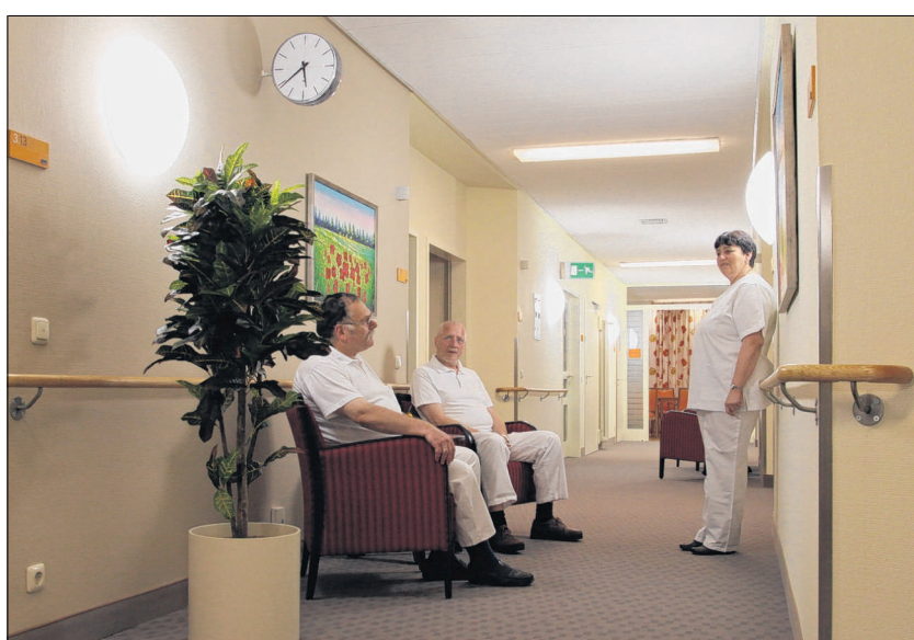
Teppichboden, Sessel und eine angenehme Beleuchtung – auch der Flur der Kurzzeitpflege-Abteilung vermittelt „Hotelatmosphäre“.